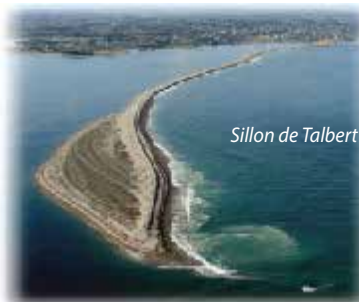
Sillon de Talbert

♦ Si vous trouvez des anomalies sur votre passage (absence de balisage, dégradations,...), merci de le signaler à l'office de tourisme.