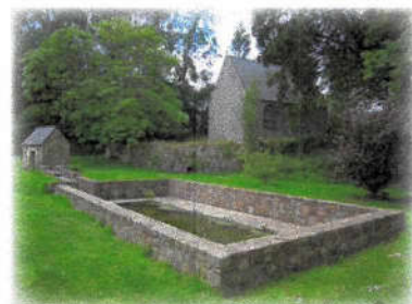
Chapelle et lavoir de Brestan

7 Chapelle Notre-Dame de Brestan (privée). Réédifiée en 1768-1769 sous la direction d'Yves Collen, maître maçon de Pleubian. Il y a inséré une pierre portant la date de 1652. Pendant la Révolution, les prêtres réfractaires y célébraient la messe.