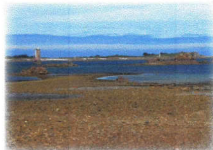
Le phare de la Corne et l'île d'Er depuis Port-Béni

8 De retour au bourg, appréciez la chaire-calvaire (fin XV e ) près de l'église Saint-Georges. Elle aurait été élevée en souvenir des prédications de Saint-Vincent Ferrier. Son parapet sculpté retrace les scènes de la passion du Christ. Exemple de « calvaire historié », ce monument marque un tournant dans la fabrication de ces monuments, auparavant simples croix de chemin.